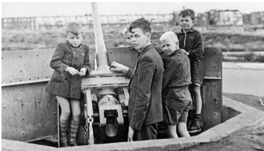
Kinderen in Duindorp bij een luchtafweerkanon.

Lees de introductietekst. Wist jij dat NSB'ers en andere verraders na de oorlog werden opgesloten in dit soort kampen?