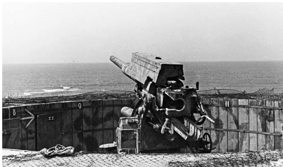
Luchtafweergeschut in de duinen nabij de Wieringsestraat, politiefoto uit 1945.

Onder deze duin ligt veel beton, op de duintoppen om ons heen stonden vijf open geschutopstellingen voor de luchtafweer. Op de duin waar we nu staan, stond ook luchtdoelgeschut.