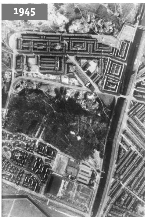
Luchtfoto van Duindorp (boven) met verticaal rechts het Verversingskanaal. Foto in 1945 gemaakt door de RAF, de Britse luchtmacht. (Collectie Haags Gemeentearchief)