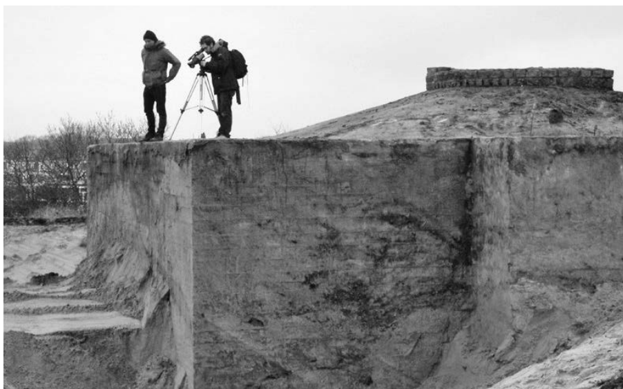
De bunker op de duintop van de Hoge Nol, zoals deze in 2009 (tijdelijk) werd opgegraven.

Dit duin is tijdens en vlak na de oorlog een belangrijke plek voor veel Duindorpers. In de eerste oorlogsdagen – vóór de evacuaties – komen de mannen van het dorp hier bijeen om elkaar de laatste nieuwtjes te vertellen. In 1945 komt er een hoge prikkeldraadomheining om Kamp Duindorp, vier rijen dik. Daar zitten collaborateurs (verraders) opgesloten. De Duindorpers kunnen vanaf de Hoge Nol hun eigen huis bijna aanraken, maar ze kunnen er niet naar toe. Pas na 1946 worden de eerste straten voor de eigen bewoners vrijgegeven. De hele wijk is pas weer bewoonbaar in 1953.