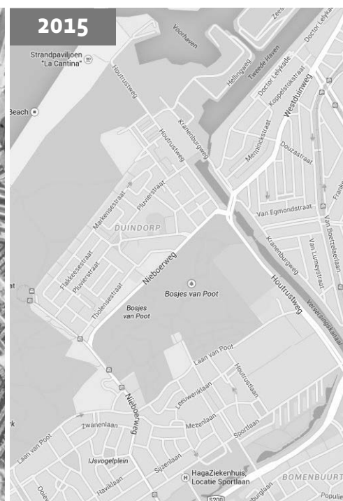
Den Haag in 2015.