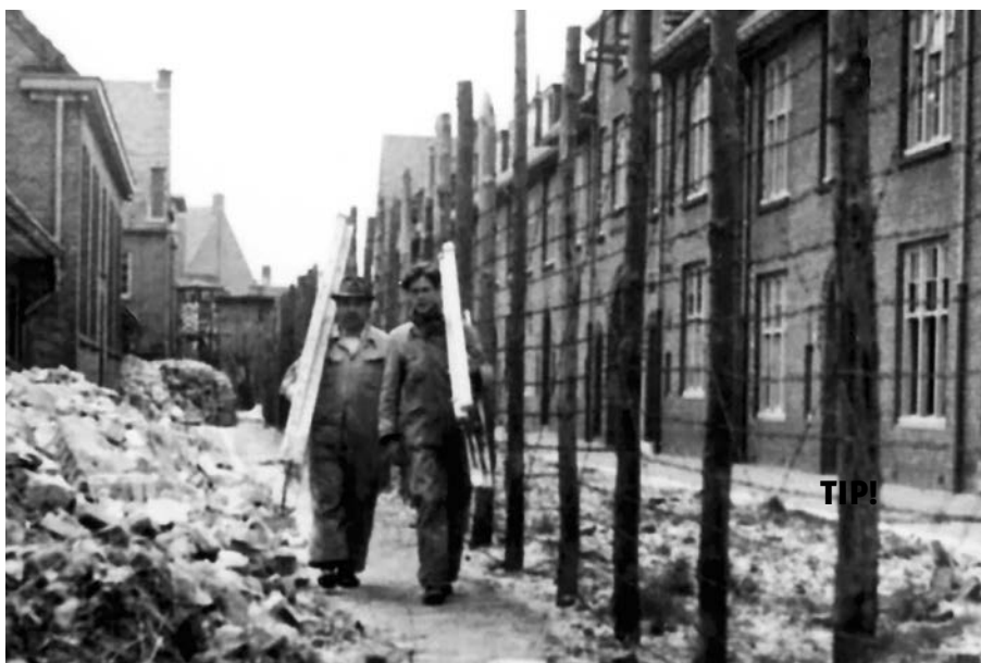
Het hek om kamp Duindorp.

In het kamp gaat het er niet altijd zachtzinnig aan toe. De onervaren bewakers worden vaak omgekocht en delen soms straffen uit zonder reden. Als er in de loop van 1946 nog steeds geen schot komt in de afhandeling van de gevallen, begint het te broeien. Op 17 juni loopt het uit de hand en ontstaan er rellen. De belangrijkste brandhaard is hier, in de Pluvierstraat. Vanaf deze hoek lost de buitenbewaking de eerste schoten. Er valt één dode. De volgende ochtend is de zaak weer onder controle. Na de opstand komt de juridische afhandeling in een stroomversnelling. De lichte gevallen worden in de loop van 1946 vrijgelaten, de rest wordt afgehandeld door bijzondere gerechtshoven.