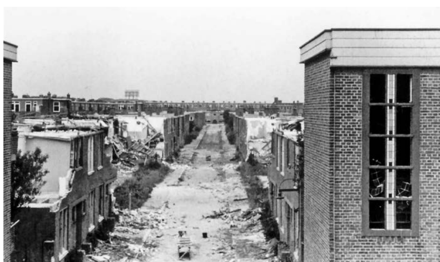
Een V2 die te vroeg naar beneden viel en terecht kwam in de Flakkeesestraat, begin 1945.

Zoek op: welke catastrofale gevolgen had de opslag van V2-raketten in Den Haag voor de wijk Bezuidenhout?