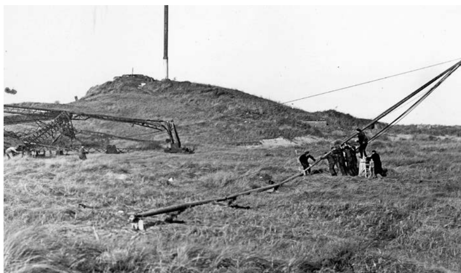
Radio Scheveningen aan de Houtrustweg wordt hersteld, foto uit 1946.

Radio Scheveningen wordt vaak aangevallen door de geallieerden, maar de zender blijft functioneren. De verwoestingen van zendgebouw en apparatuur aan het eind van de oorlog zijn het werk van de Duitse bezetter. Pas op 29 juni 1945 wordt er weer voor het eerst door Radio Scheveningen uitgezonden.