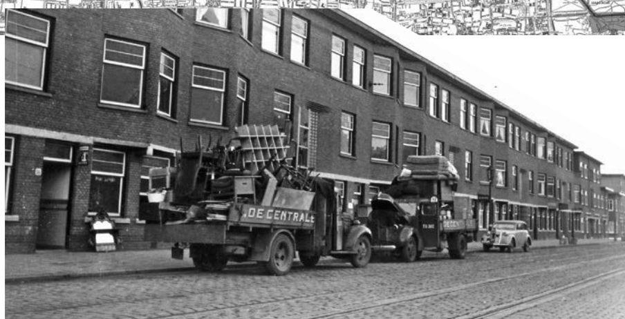
Verhuizing in de Tesselsestraat.