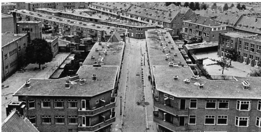
Een blik in de Terschellingerstraat. In dit deel van de wijk staat sociale woningbouw.