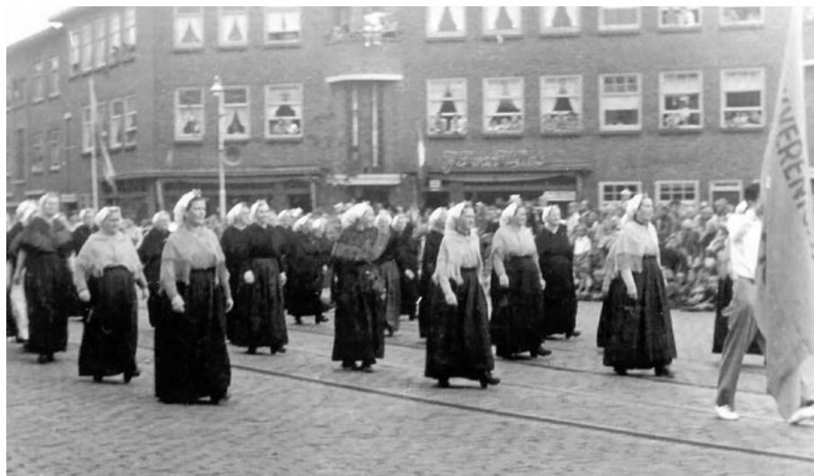
Vrouwen in Scheveningse dracht op het Tesselseplein bij de inhuldiging van het oorlogsmonument in 1952.

Het pand op nummer 1 deed dienst als wachtlokaal voor de Binnenlandse Strijdkrachten die hier kampbewakers waren. Onder het plantsoen bevinden zich nog schuilplaatsen tegen luchtaanvallen. Als je dit niet weet, lijkt nog maar weinig op dit plein te herinneren aan de oorlog. Wel zie je een herdenkingsmonument staan. Het bestaat uit drie delen. Links staat 'evacuatie 1943-44' rechts lezen we 'terugkeer na 1946'. De middelste steen vermeldt 'bezetting' – zonder jaartal.