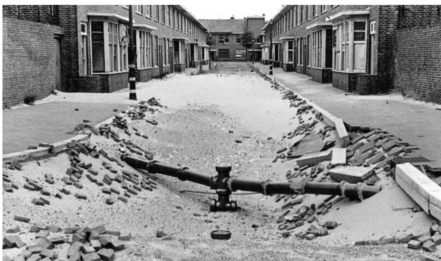
Uit veel straten werden de klinkers gehaald om te gebruiken voor bouw- en wegeaanleg. Hier de Puttensestraat in Duindorp vlak na de oorlog.

Recht voor je ligt Duindorp. Er loopt een scheiding van hier schuin naar linksachter door de wijk. Dat is de Tesselsestraat, met aan het eind het Tesselseplein. Rechts daarvan is sociale woningbouw, waar voor de oorlog het gewone vissersvolk woont. Links daarvan en in de Tesselsestraat zelf, is de woningbouw in particuliere handen. Daar wonen de schippers, stuurliu en monteurs. Ze hebben een positie tussen de vissers en de reders en voelen zich daarom vaak beter dan het gewone vissersvolk.