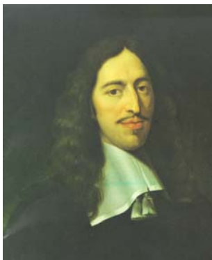
Johan de Witt

Nadat een aantal provincies in het noorden van de Nederlanden zich had los gevocht van de Spanjaarden, besloten deze landjes samen een republiek te vormen. De Oranjes, die erg belangrijk waren geweest in de oorlog, werden legeraanvoerder in dienst van de regering. Ze kregen de titel stadhouder, woonden in mooie paleizen, maar hadden officieel niets te zeggen. Natuurlijk hadden ze wel heel veel invloed en ze waren razend populair bij het volk. Vaak was er ruzie tussen de regenten (politici), die het voor het zeggen hadden en de stadhouder. Twee keer had zo'n ruzie een dodelijke afloop. De eerste keer was dat Johan van Oldenbarnevelt, die in 1619 op het Binnenhof werd onthoofd. De tweede keer was dat Johan de Witt, die samen met zijn broer in 1672 door een woedende menigte werd doodgeslagen voor de Gevangenpoort. De machtigste Oranje was Willem III. Behalve stadhouder, werd hij in 1688 ook koning van Engeland.