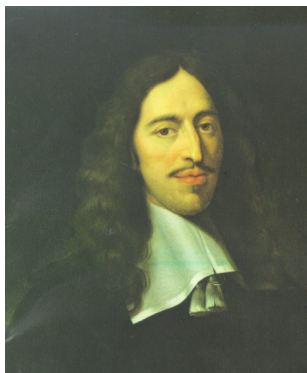
Johan de Witt

Nadat een aantal provincies in het noorden van de Nederlanden zich had los gevochten van de Spanjaarden, besloten deze landjes samen een republiek te vormen. De Oranjes, die erg belangrijk waren geweest in de oorlog, werden legeraanvoerder in dienst van de regering. Ze kregen de titel stadhouder, woonden in mooie paleizen, maar hadden officieel niets te zeggen. Natuurlijk hadden ze wel heel veel invloed en ze waren razend populair bij het volk. Vaak was er ruzie tussen de regenten (politici), die het voor het zeggen hadden en de stadhouder. Twee keer had zo'n ruzie een dodelijke afloop. De eerste keer was dat Johan van Oldenbarnevelt, die in 1619 op het Binnenhof werd onthoofd. De tweede keer was dat Johan de Witt, die samen met zijn broer in 1672 door een woedende menigte werd doodgeslagen voor de Gevangenpoort. De machtigste Oranje was Willem III. Behalve stadhouder, werd hij in 1688 ook koning van Engeland.